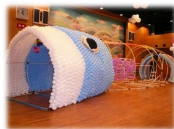
※写真は過去に開催したときのものです。